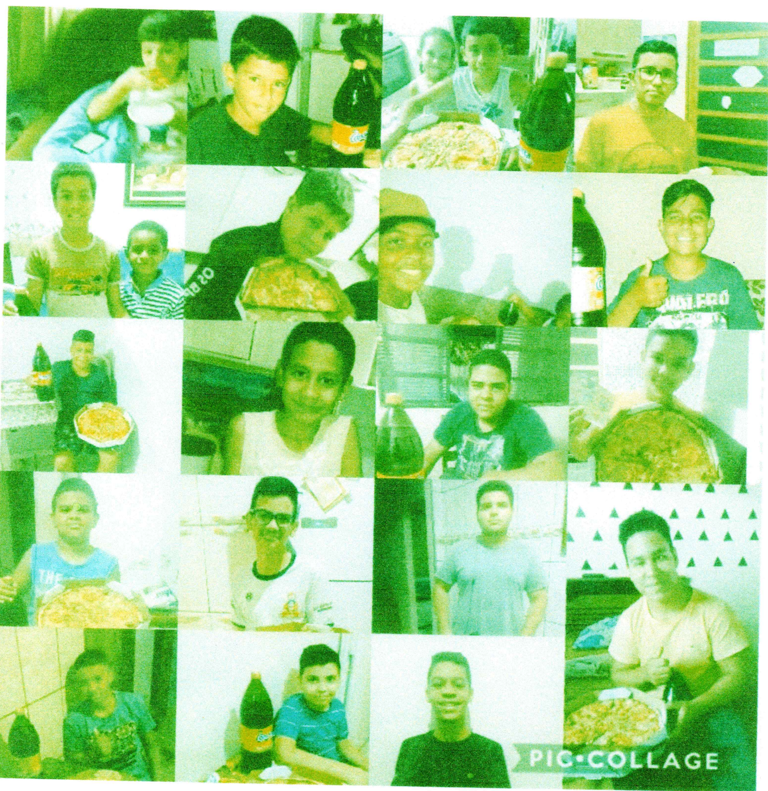
▶ PIC • COLLAGE